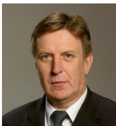
Māris KUČINSKIS, Prime Minister of the Republic of Latvia

Марис Кучинскис, министър-председател на Латвийската република