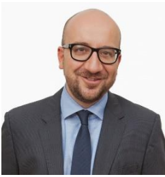
Charles MICHEL, Prime Minister of the Kingdom of Belgium

Шарл Мишел, министър-председател на Кралство Белгия