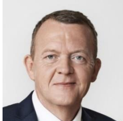
Lars LØKKE RASMUSSEN, Prime Minister of the Kingdom of Denmark

Стефан Льовен, министър-председател на Кралство Швеция