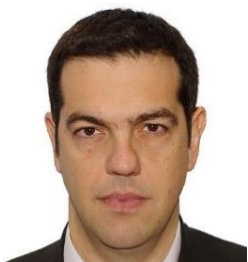
Alexis TSIPRAS, Prime Minister of the Republic of Greece

Антонио Таяни, председател на Европейския парламент