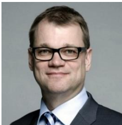
Juha SIPILÄ, Prime Minister of the Republic of Finland

Марк Рюте, министър-председател на Кралство Холандия