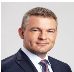
Peter PELLEGRINI, Prime Minister of the Slovak Republic

Виктор Орбан, министър-председател на Унгария