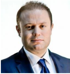
Joseph MUSCAT, Prime Minister of the Republic of Malta

Матеуш Моравецки, министър-председател на Република Полша