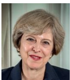
Theresa MAY, Prime Minister of the United Kingdom of Great Britain and Northern Ireland

Еманюел Макрон, президент на Френската република