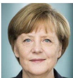
Angela MERKEL, Federal Chancellor of Germany

Тереза Мей, министър-председател на Обединено кралство Великобритания и Северна Ирландия