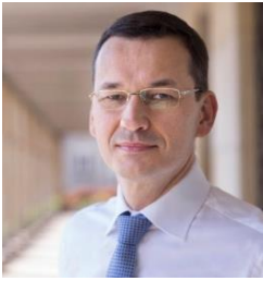
Mateusz MORAWIECKI, Prime Minister of the Republic of Poland

Шарл Мишел, министър-председател на Кралство Белгия