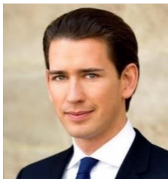
Sebastian KURZ, Federal Chancellor of Austria

Марис Кучинскис, министър-председател на Латвийската република