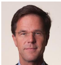
Mark RUTTE, Prime Minister of the Kingdom of the Netherlands

Марк Рюте, министър-председател на Кралство Холандия