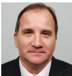
Stefan LÖFVEN, Prime Minister of the Kingdom of Sweden

Себастиан Курц, федерален канцлер на Република Австрия