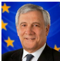
Antonio TAJANI, President of the European Parliament

Юха Сипиле, министър-председател на република Финландия