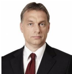
Viktor ORBÁN, Prime Minister of Hungary

Джоузеф Мускат, министър-председател на Република Малта