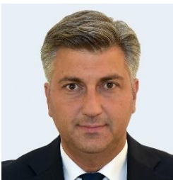
Andrej PLENKOVIĆ, Prime Minister of the Republic of Croatia

Петер Пелегрини, министър-председател на Словашката република